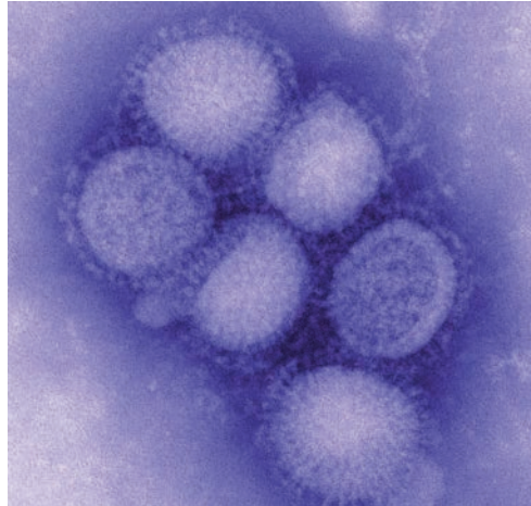
Imagen del Virus H1N1 a través de microscopio electrónico.

IA. ¿Cuáles son las medidas preventivas que se deben adoptar?