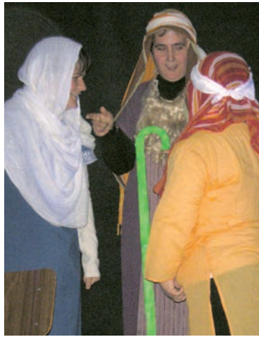
Teatro de Navidad 2008. La Taberna de Elias.