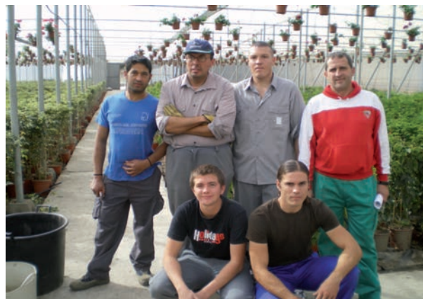
El personal del C.E.E. en el invernadero de plantas ornamentales.

El Centro Especial de Empleo (C.E.E.) de ASPAPROS en su sección de jardinería, se dedica principalmente al cultivo de las plantas ornamentales, montaje de conjuntos de riego y servicios de jardinería. Genera seis puestos de trabajo estables para personas con discapacidad intelectual. Todos ellos profesionales con sobrada capacitación y experiencia. Al igual que a otros sectores, la crisis