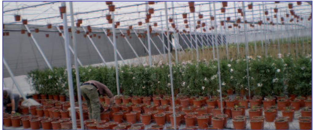
Vivero del Centro Especial de Empleo de ASPAPROS en Viator. Trabajando los jazmines y bignonias bajo gitanillas y geranios.