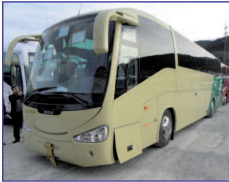
Finalizando el montaje del autobús.

ASPAPROS y la empresa de transporte Frahemar, han alcanzado un acuerdo para la prestación del servicio de transporte de los clientes de estancias diurnas durante los próximos seis años.