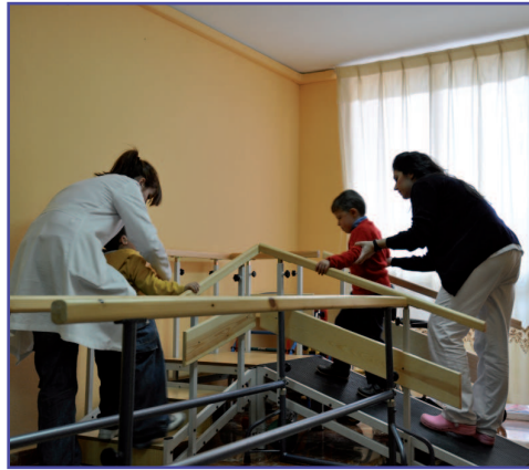
Psicomotricidad en el Aula de Fisioterapia.