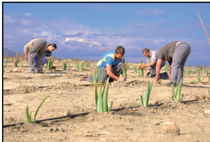
Personal del C.E.E. de ASPAPROS en las labores de plantación del Aloe Vera.

IX Jornadas de convivencia de ASPAPROS en Aguadulce Sigue en la pág. 4