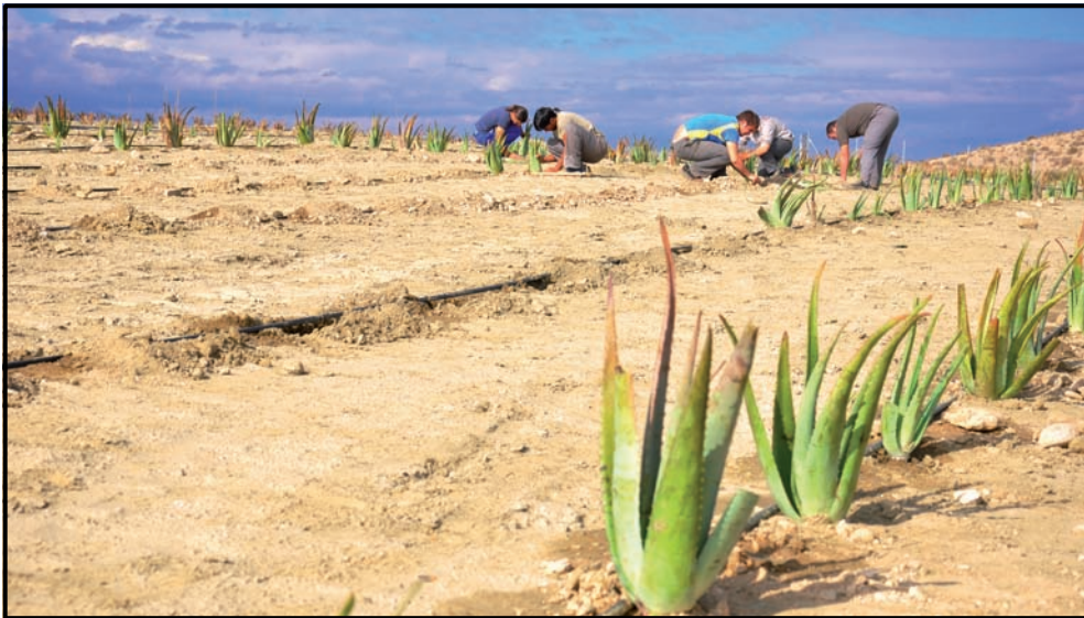
Terreno junto a las instalaciones de ASPAPROS en el municipio de Viator, acondicionado para el cultivo ecológico de Aloe Vera.