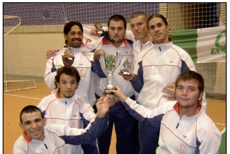
Equipo de Fútbol Sala de ASPAPROS con el trofeo de campeón provincial de la Liga FEAPS.

En la emotiva ceremonia de clausura, se hizo entrega de los trofeos a los diferentes equipos, además de los trofeos individuales.